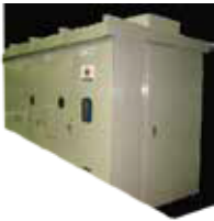
屋外キュービクル